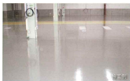
塗装色は指定色グレー

※日塗工色見本には無いため色見本を掲載します。 ※この色見本は印刷物のため実際の色調とは多少異なります。 標準色の指定・選定・ご注文は必ず別冊の標準カラーサンプルをお願いします。